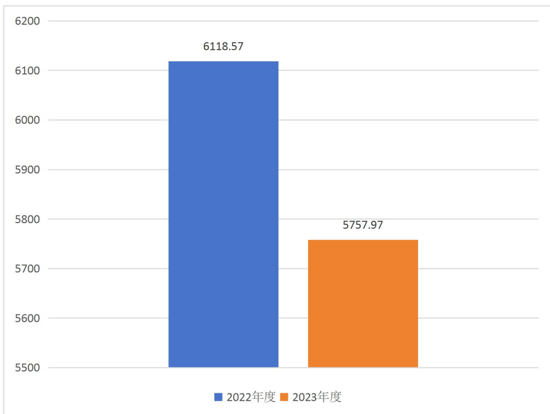
图 1：收支总计对比情况（单位：万元）

本部门 2023 年度收、支总计（含结转和结余）5,757.97 万元。与 2022 年度决算相比，收支各减少 360.6 万元，下降 5.89%，主要原因是 2023 年度非税收入减少，项目支出减少。