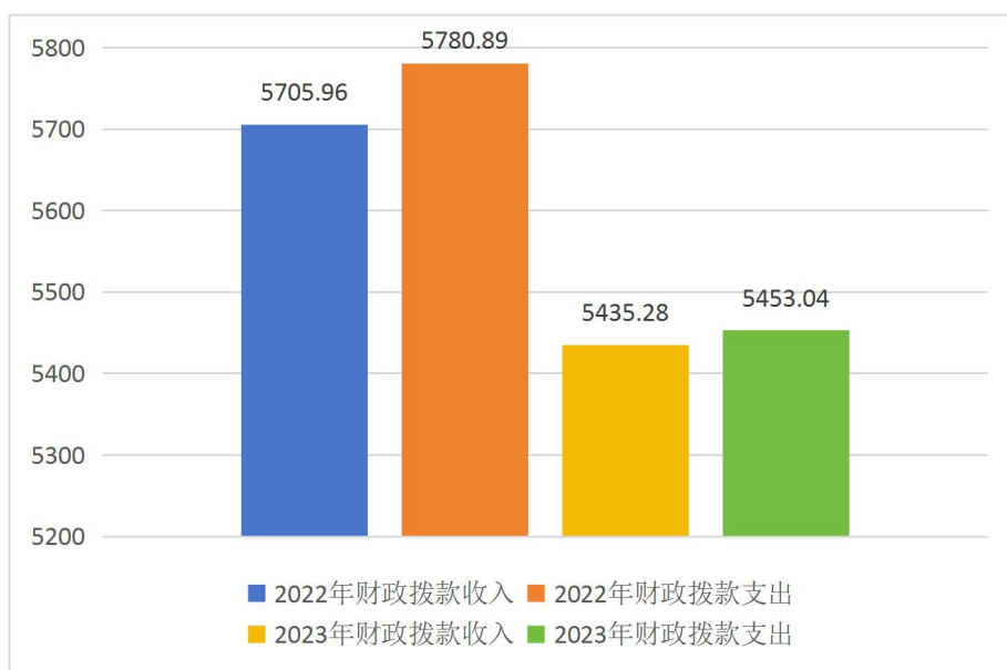
图 3: 财政拨款收支与上年对比情况 (单位: 万元)

3. 国有资本经营预算财政拨款本年收入0万元, 与上年持平; 本年支出0万元, 与上年持平。